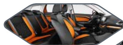
SITZHEIZUNG FAHRER, BEIFAHNER UND RÜCKSITZBANK