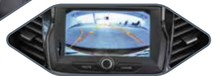
7 ZOLL MULTIMEDIA SYSTEM MIT NAVIGATION FÜR EUROPA